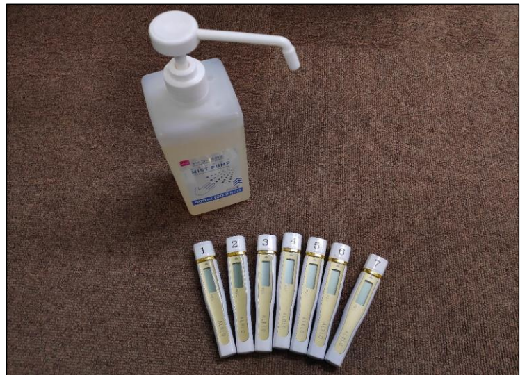
アルコールチェッカー